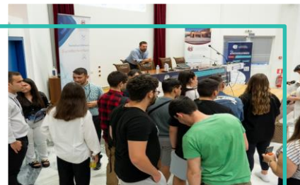
Soft Skills, Καλαμάτα