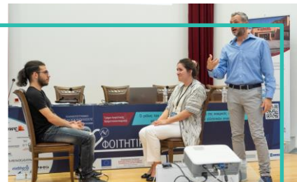
Διαμόρφωση Επαγγελματικής Εικόνας, Καλαμάτα