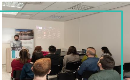
Negotiation Expertise, Τρίπολη