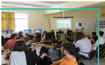
Business Game, Πάτρα