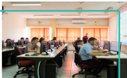
Investment Game, Καλαμάτα